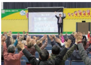
センター主催のイベント